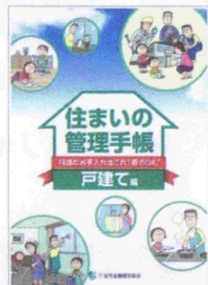
住まいの管理手帳イメージ