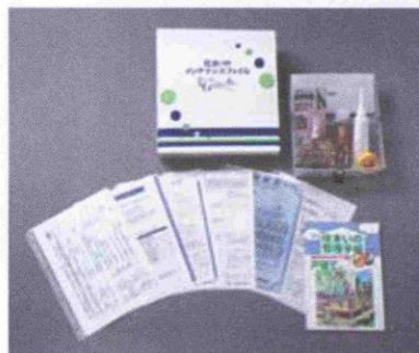
メンテナンスファイル・お手入れセットイメージ

(3) 住まいの管理手帳 安全で快適に住むための注意やルール、日常のお手入れ、住まいの防災・防犯対策について一般的な事項をまとめた書籍です。