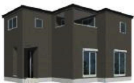
1号棟外観完成イメージ